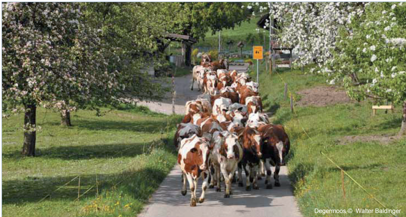
Degermoos © Walter Baldinger